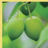
カカドゥプラム エキス※1