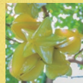
スターフルーツ エキス※3